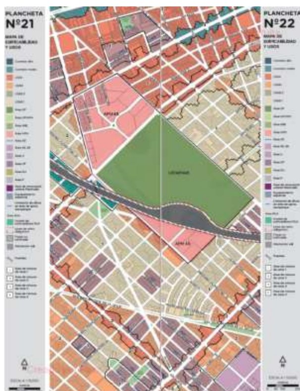
Edición de Planchetas N°21 y N°22 efectuadas por el Juzgado N°4

De la compulsua efectuada en los registros digitales del Gobierno de la Ciudad de Buenos Aires, la plataforma digital 3D del Gobierno de la Ciudad de Buenos Aires identifica en sus planchetas N°21 y N°22 el Área de Protección Histórica 45 (APH 45) en su conjunto. 3